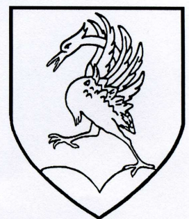
Commune de Rougemont