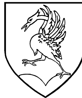
Commune de Rougemont

(Règlement de la taxe communale de séjour approuvé par les conseils communaux en décembre 2007)