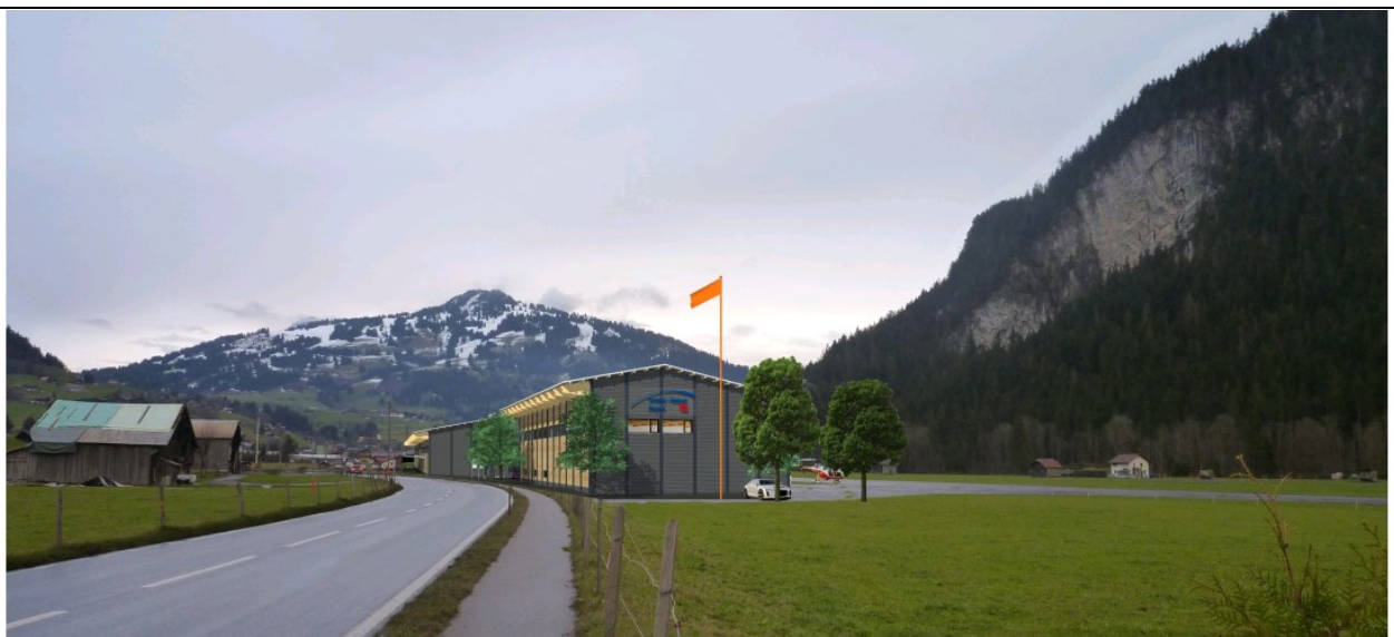
Vue depuis l'ouest